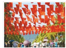
图片报道：最美“中国