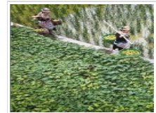
图片报道：绿色发展新