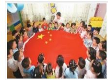
图片报道：开学第一课